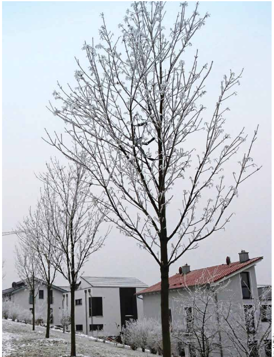
Abb. 1: Spitzahorne in der Jugendphase

urteilenden Baum noch eine angemessene Reststandzeit am Standort zugesprochen wird.