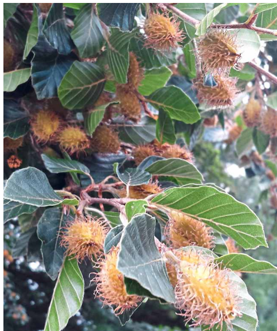
Abb. 3: Rotbuche mit generativen Kurztrieben und Fruchtanhang

Der beschriebene altersbedingte Kronenumbau lässt sich von einer traumatischen Vitalitätsschädigung durch die auffälligen Unterschiede in der Blühhäufigkeit zwischen geschädigten und seneszenten Bäumen abgrenzen [9]. Da die Fruchtbildung einen erheblichen Energieaufwand erfordert [19], fruktifizieren devitalisierte Altbäume seltener und tragen weniger Mast als vitale. Die Fähigkeit alter Bäume, regelmäßig und