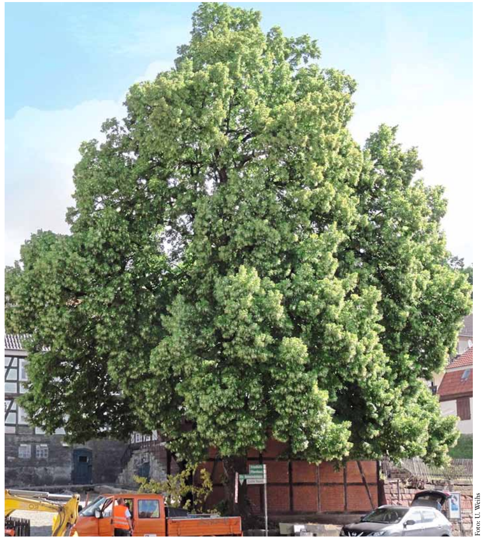
Abb. 4: Stark fruktifizierende Linde in der Alterungsphase

Im Gegensatz zum Wald und der freien Landschaft ist an Standorten mit berechtigter Sicherheitserwartung des Verkehrs ein allmähliches Absterben der Oberkrone von alten Bäumen aus Gründen der Verkehrssicherheit nicht tolerierbar.